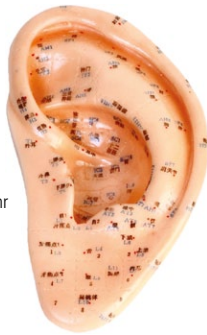
Reflexpunkte am Ohr

Die Grundlage der Ohrakupunktur sind Reflexpunkte. Die Lokalisierung und Identifizierung erfordern ein hohes Maß an Erfahrung.