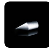
Implantat aus Titan*

die sanfte Alternative bei vielen chronischen Krankheitsbildern