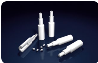
Lametec Implax Nadeln zur Implantat-Akupunktur am Ohr

Das noch relativ junge Therapieverfahren konnte bereits beachtliche Erfolge vorweisen und so wurden zusätzlich zu verwendeten Titan-Implantaten sogenannte Templantate entwickelt. Diese bieten die Möglichkeit, eine 15-18monatige Therapie durchzuführen, ohne daß das Implantat lebenslang im Ohr verbleibt.