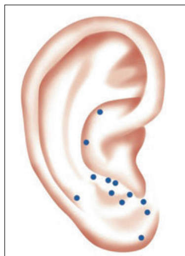
Abb. 1: Mögliche Ohrpunkte beim Restless-Legs-Syndrom

Nieren-Yin-Mangel, Aufsteigendes-Leber-Yang, Leber-Feuer Kennzeichnend für das RLS-Syndrom ist ein relatives Überwiegen von Yang zu Yin, entweder in der Fülle (Leber) oder in der Leere (Niere). Folglich konnten nach den Kriterien der TCM die Ohrpunkte Leber (Ohrpunkt 97) und/oder Niere (Ohrpunkt 95) ausgewählt werden. Somit konnte insgesamt eine maximale Anzahl von zwölf Implantaten pro Ohr eingesetzt werden (s. Abb. 1).